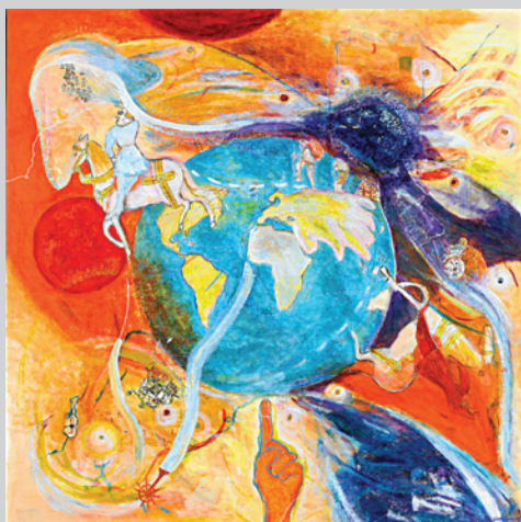
Kloden, Helge Nordstrøm

Gruppen består af en blanding af billedkunstnere, kunsthåndværkere, mv.